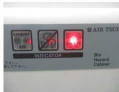
シャッター安全機能OK